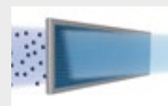
Filtro foto catalitici.