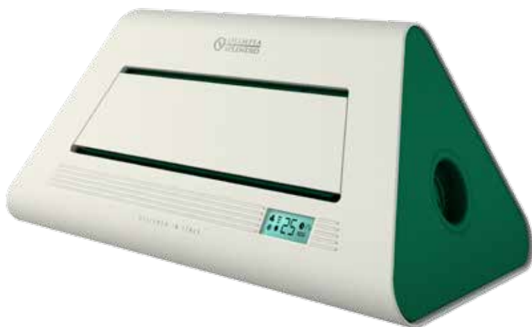
Design by Ercoli & Garlandini

Resistenza Ceramica ad alta efficienza Funzione Eco Potenza termica max: 1800 W 2 livelli di potenza (1000 - 1800 W) LCD display Timer 12h Termostato di sicurezza Termostato Ambiente Funzione Anti-Gelo Funzione di sola ventilazione Interruttore di sicurezza anti ribaltamento Telecomando Volume riscaldabile: 65 m 3